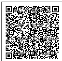
Ilustración 1 QR de ejemplo

https://catalogo-ypfe.dian.gov.co/document/searchqr?documentkey=e5bac48e354bc907bccff0ea7d45fbf784f0a8e7243b58337361e1fbd430489d